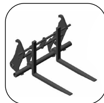
Widły Zamontowane na Szybkozłączu